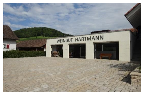
Weingut Hartmann Remigen

Zwei Weltreiche haben in der heutigen Region Brugg-Windisch imposante bauliche Spuren hinterlassen. Kleine Teile davon werden wir besichtigen, allen voran die Klosterkirche Königsfelden mit den berühmten farbigen Glasfenstern aus dem Spätmittelalter. Wir beginnen jedoch in Remigen mit dem Besuch von einem der Römerrebberge. Der mit Informationstafeln ausgestattete Weg stellt die fünf Remiger Reblagen dar, beschreibt den Rebberg als komplexes Ökosystem und informiert über die Arbeit der Winzer.